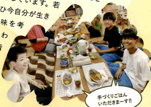
手づくりごはん いただきます!!

お墓づくりを中心に営業しているという石材では、お墓そうじや文字彫刻を体験しました。体力には自信のあるサッカー、バスケ少年たちですが、慣れない外作業は疲れたようです。午前中暑い中で体を使って仕事をした後、おいしい手料理をふるまっていたいただきました。そして「いのちの積み木」というおもちゃを使った命の話。「生徒の皆さんにはまず自分の家のお墓参りに行くかを聞きます。今年の子たちは『よく行く』と答えてくれて頼もしい。お墓は、ご先祖への感謝の気持ちを持ち、命の大切さを実感できる場所。そんな場づくりをお客様と一緒にできることをいつもありがたく感じています。若い人たちにもぜひ今自分が生きていることの意味を考え、人の気持ちのわかる人間、将来親の看取りができる人間に成長してほしいと願っています」。