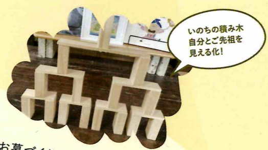
いのちの積み木 自分とご先祖を 見える化！

地域の皆さん、受け入れてくださってありがとうございました。これからも小淵沢中学校の生徒をあたたく、時には厳しくご指導ください！