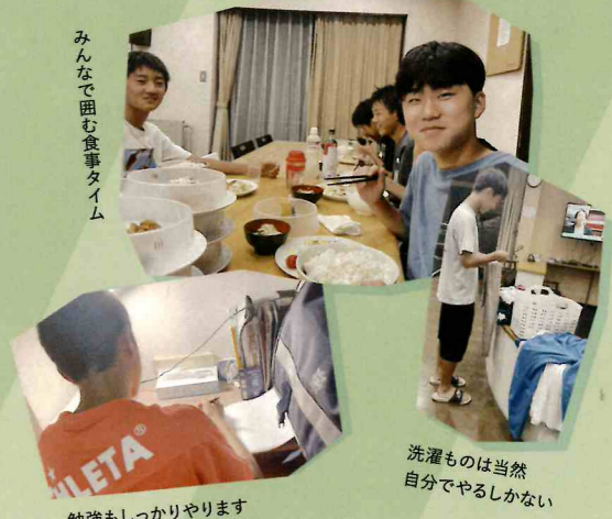
みんなで囲む食事タイム

平日の下校後→練習or勉強→食事・洗濯・入浴→就寝22:30 (2つのグループに分かれて入替)