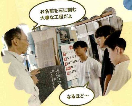
お名前を石に刻む 大事な工程だよ