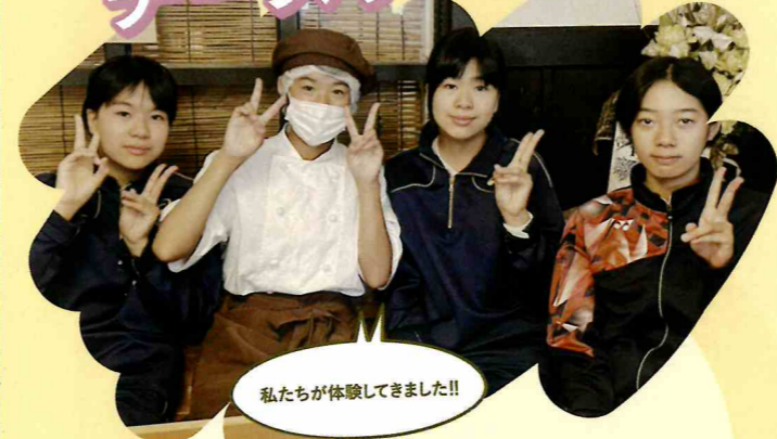
私たちが体験してきました!!

八ヶ岳チーズケーキ工房に伺ったのは、お菓子づくりが大好きな女子4人。製造やパッケージングを体験しました。ちょっとおしゃべりはありましたが、明るく元気に職場体験してもらえてなにより、とスタッフの富澤さんは話します。「お店が開店してから20年以上経ちますが観光バスなどの県外のお客様が多く、地元のお客様との接点がありませんように感じています。中学生が地元の企業で職場体験することによって当店はもちろん、地元で働き地域を活性化していく意識をもってもらえるきっかけになると良いと思い職場体験を受け入れました」。生徒からは「ちょっとの失敗がお客様に迷惑をかける」「店員さんの陰の動きも勉強になった」と感想をいただきました。