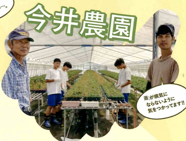
苗が病気になるように 気をつけてます!!

毎年2年生は夏休みの2日間、市内の企業や店で職場体験をします。今年もたくさんの事業所が、小淵沢中学2年生を受け入れてくれました。そこでその中の5ヶ所事業所へ報道部がお邪魔してきました！