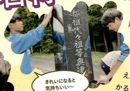
きれいになると 気持ちいい〜