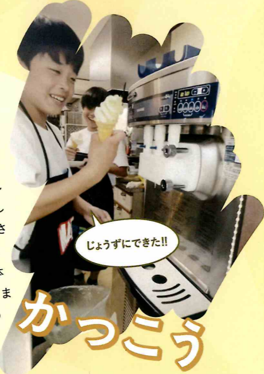
じょうずにできた!!