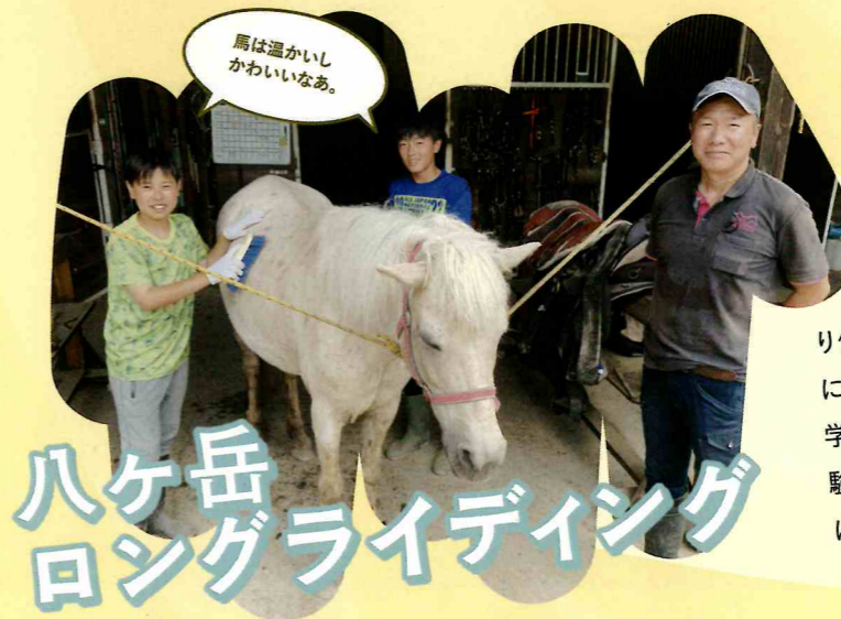
馬は温かいし かわいいなあ。