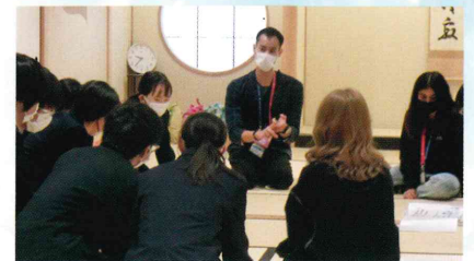
語学研修セミナー