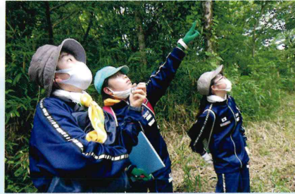
オオムラサキ有視界調査