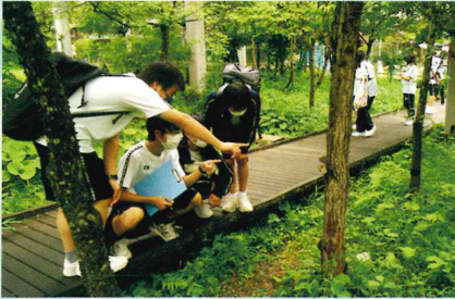
オオムラサキセンター研修