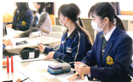
高校生との交流授業