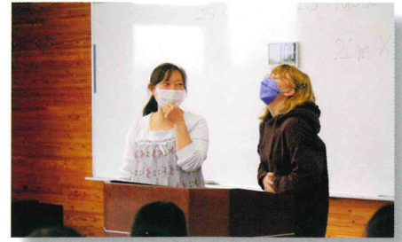
A L T との楽しい英語