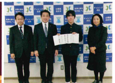
少年の主張全国大会 内閣総理大臣賞