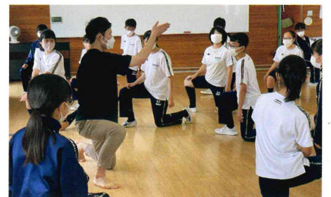
演劇ワークショップ