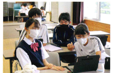
小学校との交流授業（オンライン）