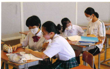
高校生による学習サポート