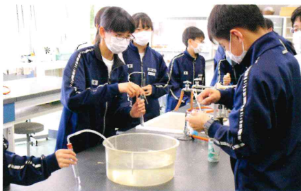
実験や観察も充実