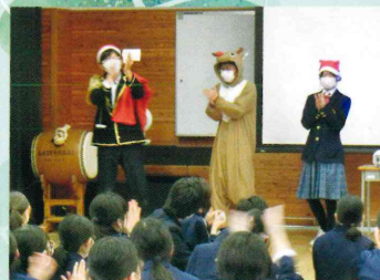
クリスマス会 (全校レク)