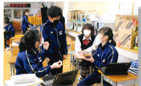
話し合いでもPC活用